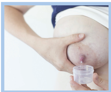
Vắt sữa bằng tay